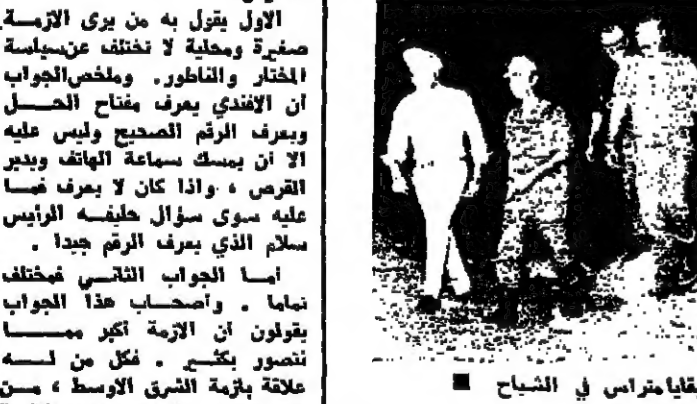
أفراد دورية مشتركة فوق بقايا ممراسم في الشياح

الاول يقول به من يرى التهمة صفة ومصلحة لا تختلف عن سياسة المختار والناظر، ويخلص الجواب ان الانديت يعرف مفتاح الحصل ويعرف الرقم الصحيح وليس عليه الا ان يسك سياسة الهاتف ويدير القرض، واذا كان لا يعرف فما عليه سوى سؤال خليفة الرئيس سلام الذي يعرف الرقم جيداً. اما الجواب الثاني فيختلف تماماً، وأصحاب هذا الجواب يقولون ان التهمة اكبر مما نصورون تكسر. فكل من له علاقة بقرعة الشرق الاوسط، من فلسطين الى القطر، على علاقة ما بالآلة في لبنان، بل ان اكبر صراع دولي وعربي ومحلي يجري فوق هذه القرعة المصرية المشقة من القسيما الطبقية التي تعاقب صفا عسكريا وسياسيا واقتصاديا. ثمة صراع عربي - اسرائيلي، وثقافة عربي - عربي، فضلا عن المراتب الخفية، وبين عروش الرئيس السادات زيارة بيروت وحل التهمة كان يضع كل ذلك في حسبه. ومن هنا نحاول ان نشكل الاحداث التي يراه ان المفتاح هو في بين الرئيس فرنجية وبشر والخطة تسير الان من انتظار الى انتظار. من محطة سالتزبورغ الى محطة واشنطن الى محطة كينسجور الطفرة او الى محطة جنيف، وربما الى محطة العرب اليوم بنجاحات غورد مع راينين. ويوم ٢٠ حزيران يستقبل عبيد الطام خذام، ثم يأخذ نفسا ويقرء كما قال الخبير بين الكفورة خطوة على طريقة كينسجور، او الحصل الشليل عبر مؤتمر جنيف او الخطوة خطوة باشراف مؤتمر جنيف. وسيحاول بالخبير اختيار الحل الذي يلائم مصالح امريكا ونظرتها البقية على ص ١٤ عمود ١ - رفيق خوري